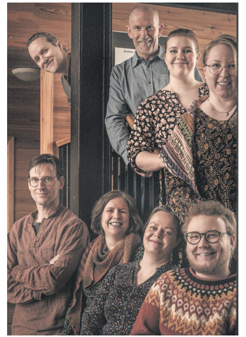
Houkutuslinnun folk soi nuorisoseurantalo Tasankolassa kesäkuussa.