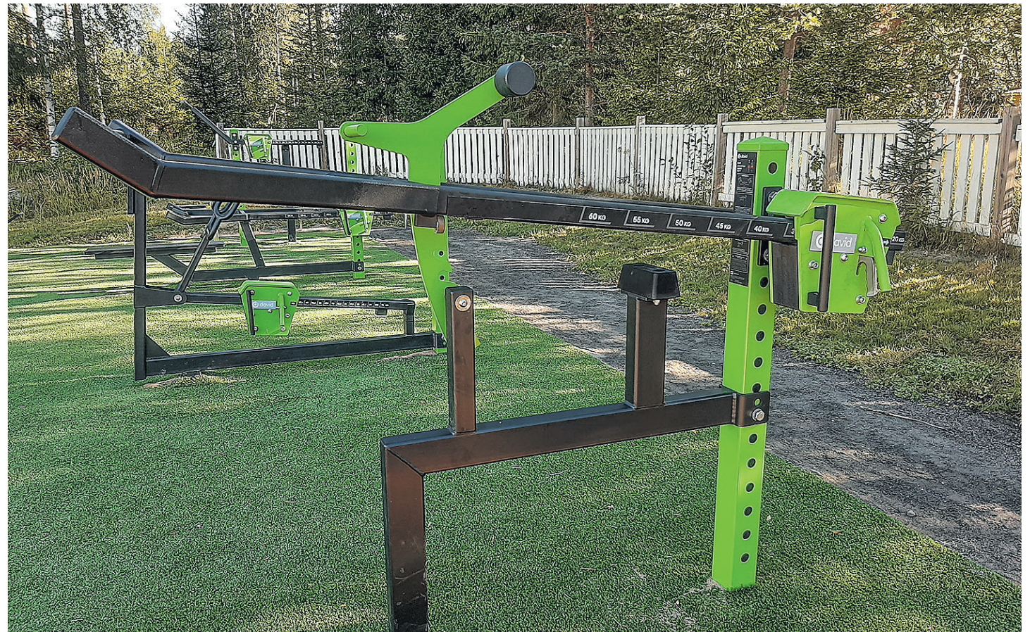
Isolahden ulkokuntosalin laitteiden käyttöastetta ja käyttäjätyytyväisyyttä mitattiin kesä-heinäkuussa 2023.

– Miten saisimme hienolle kuntoilupaikalle runsaammin käyttöä? Aktiivointia on pyritty tekemään mm. kunnan tarjoamalla ilmaisilla opastus- ja