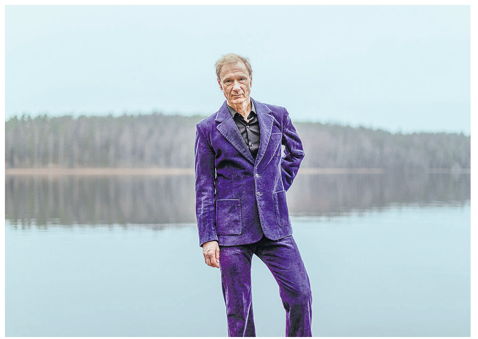
Ismo Alanko Yksin -kiertue saapuu Riihivuoreen heinäkuussa.