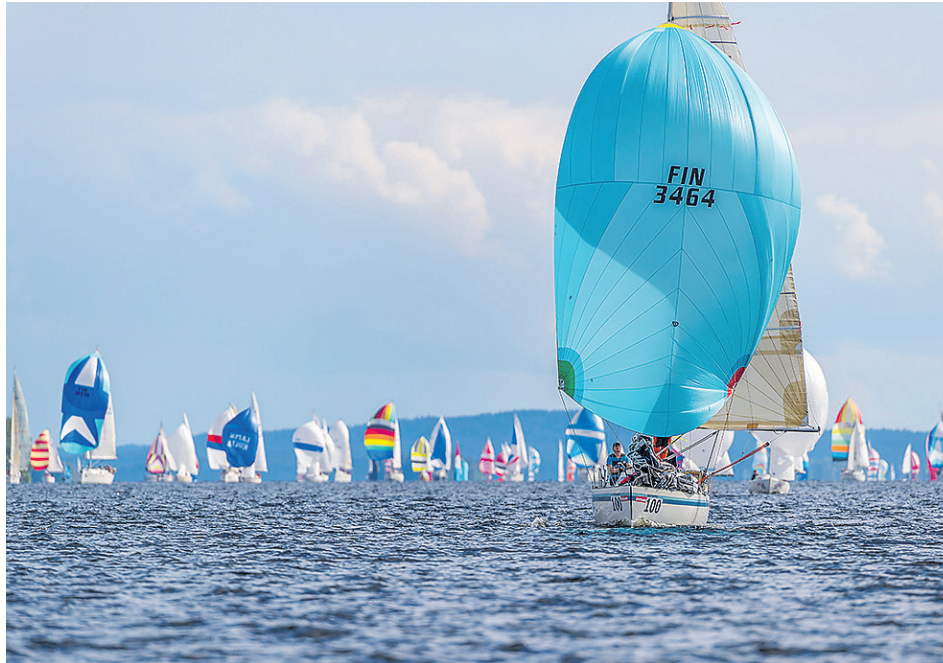
Päijännepurjehdus seilataan heinäkuussa Padasjoen ja Säynätsalon välillä. Päätöspäivänä voi Ristinselällä ja Hauhonselällä nähdä hienoja purjeveiteitä.