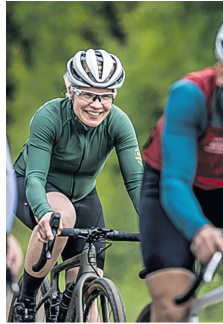
Pyöräkilpailu poljetaan Muuramen alueella heinäkuussa.

17.8. Harrastemessut Kulttuurikeskuksella (Nisulantie 2)