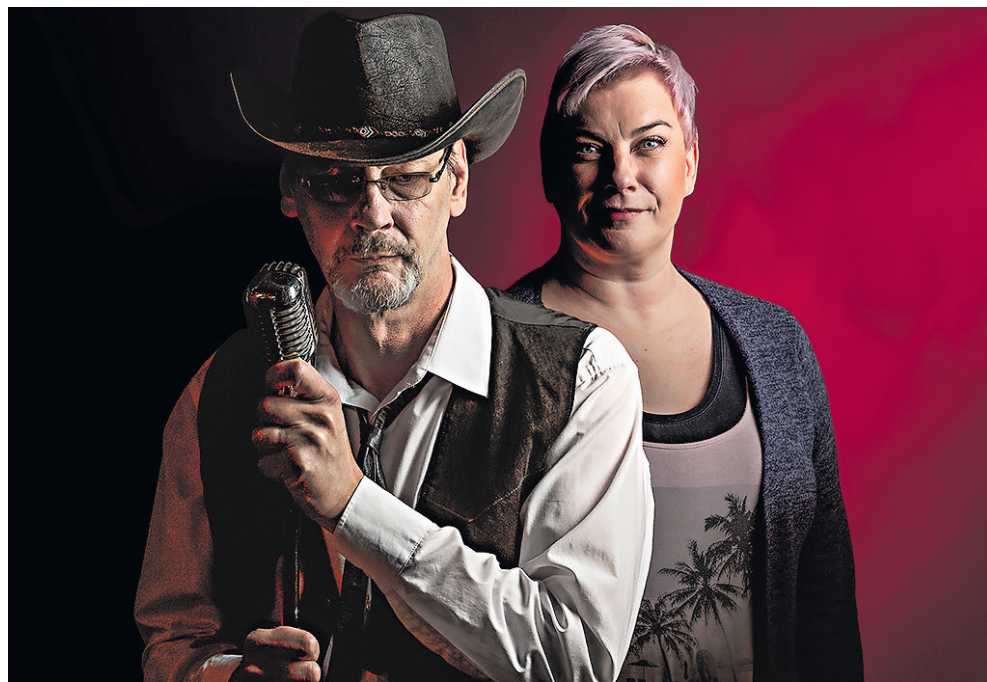
Teatteri Eurooppa Neljän kesänäytelmänä nähdään Topi Sorsakosken tarina.