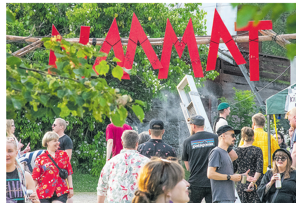
Rockfestari Naamojen tapahtumapaikka on Tuomiston tilalla Rannankylässä.