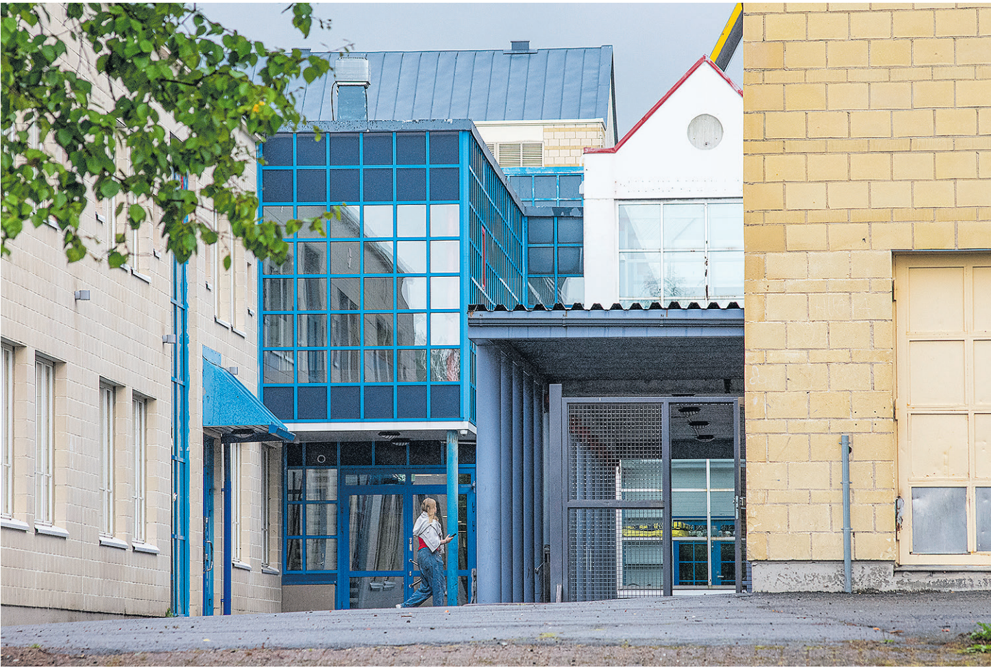
Muuramessa järjestettävä perusopetus sai lasten ja nuorten huoltajilta kelpo arvosanan, mutta parantamiskohteitakin löydettiin. Kyselyyn vastasi noin kolmannes huoltajista. Kuvassa Nisulanmäen koulu Muuramen koulunmäellä.