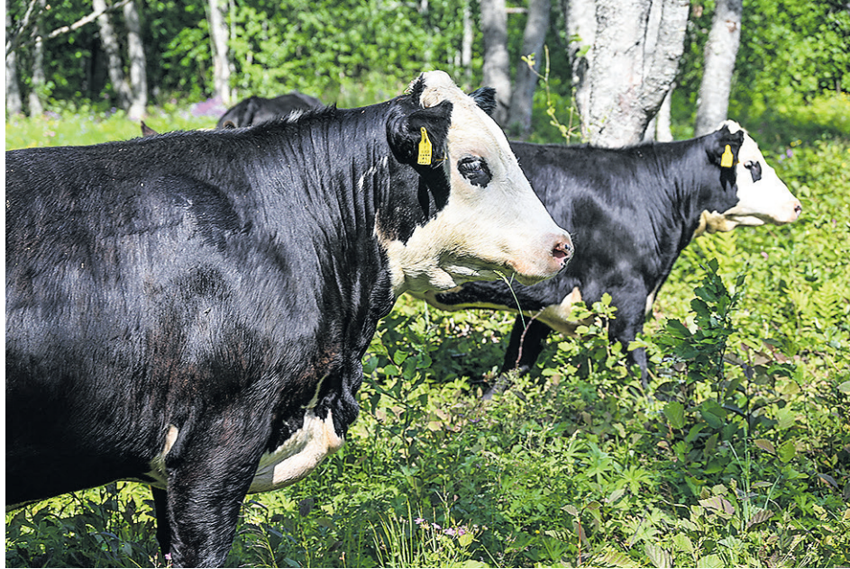
Kuvan naudat ovat Moxsin tilalta Korpilahdelta. Ne ovat laiduntaneet tänä kesänä Suuruspään niityllä, eivätkä suoranaisesti liity lähiruokapäivän ohjelmaan.

Lähiruokapäivän tapahtumia järjestetään myös Rutalahden Myllyllä (Lahdentilantie 40) klo 10-13. Haanpään kesäkahvilassa (Painaantie 60) on ovet