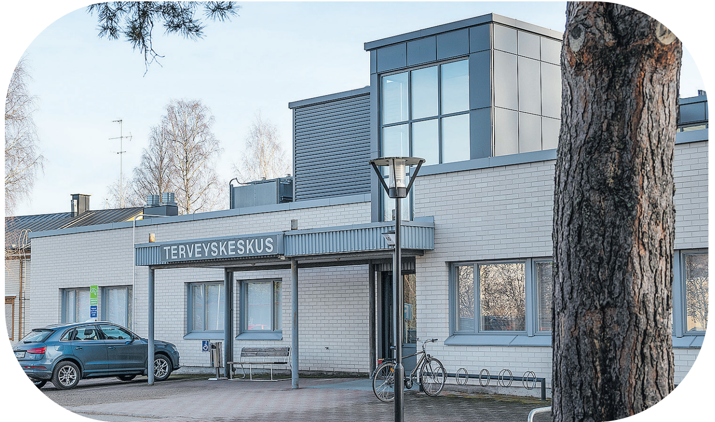
Muuramen terveysasema tarjoaa hyvät ja terveet tilat Muuramen ja lähialueen asukkaille, sekä terveydenhoitohenkilökunnalle.

”Totta on, että kuljetukset maksavat. Ajoittain on kuntakohtaisesti asiakaspaikat täynnä, jolloin ns. turhiakin kuljetuksia joudutaan järjestämään muiden kuntien alueelle.”