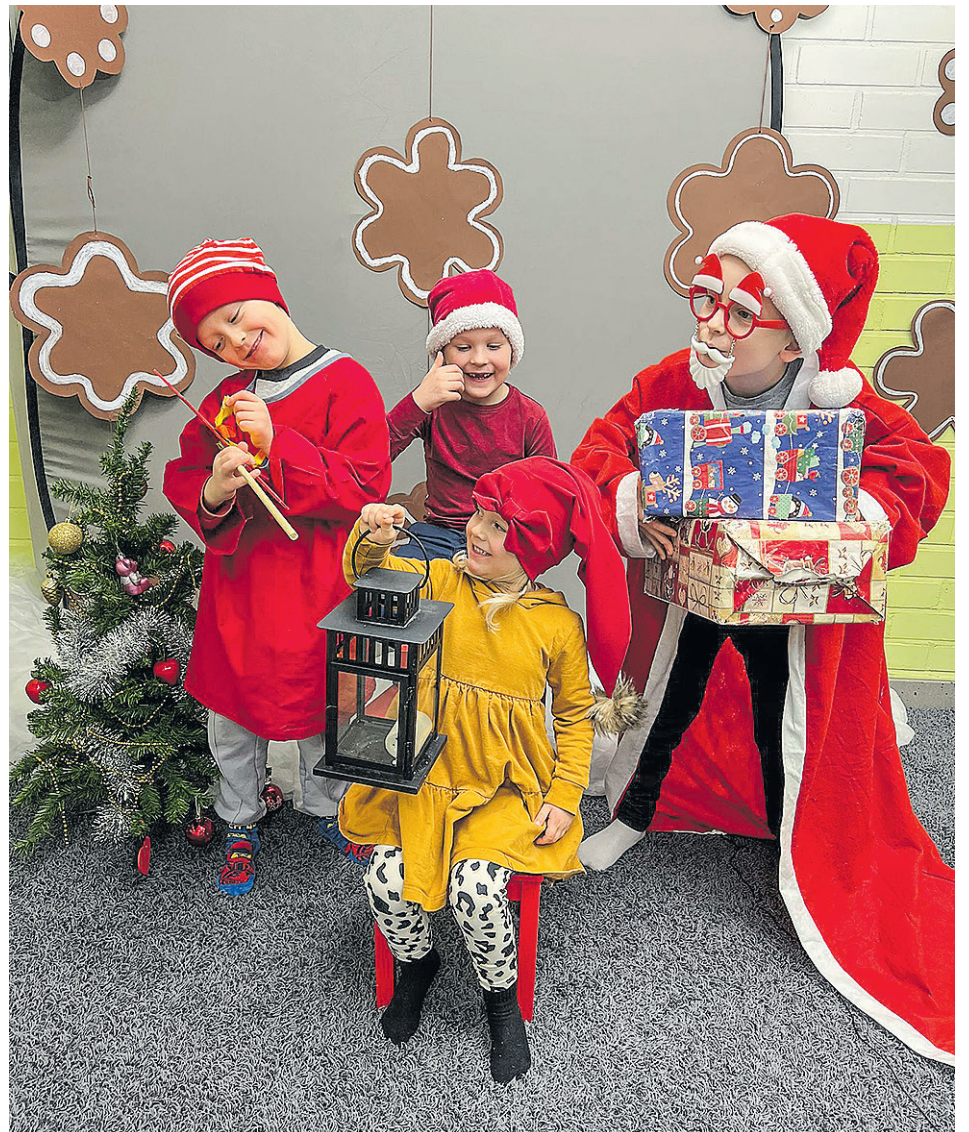
Pieniä tonttuita Kinkomaan joulutapahtuman kuvauspisteellä vuosi sitten.